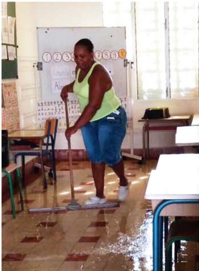
Nettoyage des écoles après Maria

Un chantier de taille : ce sont nos intelligences mises ensemble aujourd'hui qui rendront notre futur raisonné et sécurisé.