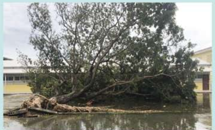
Maria a arraché l'arbre de la cour de Lucie Calendrier

Certaines écoles ont connu des inondations dans les salles de classe, les agents ont été à pied d'œuvre pour évacuer l'eau et nettoyer. Les salles ayant servi d'abris ont été désinfectées. Les cours de récréation, notamment celle de L. Calendrier, ont été remises au propre suite au tronçonnage d'un arbre déraciné. Deux jours plus tard, tout était en ordre pour accueillir les élèves.